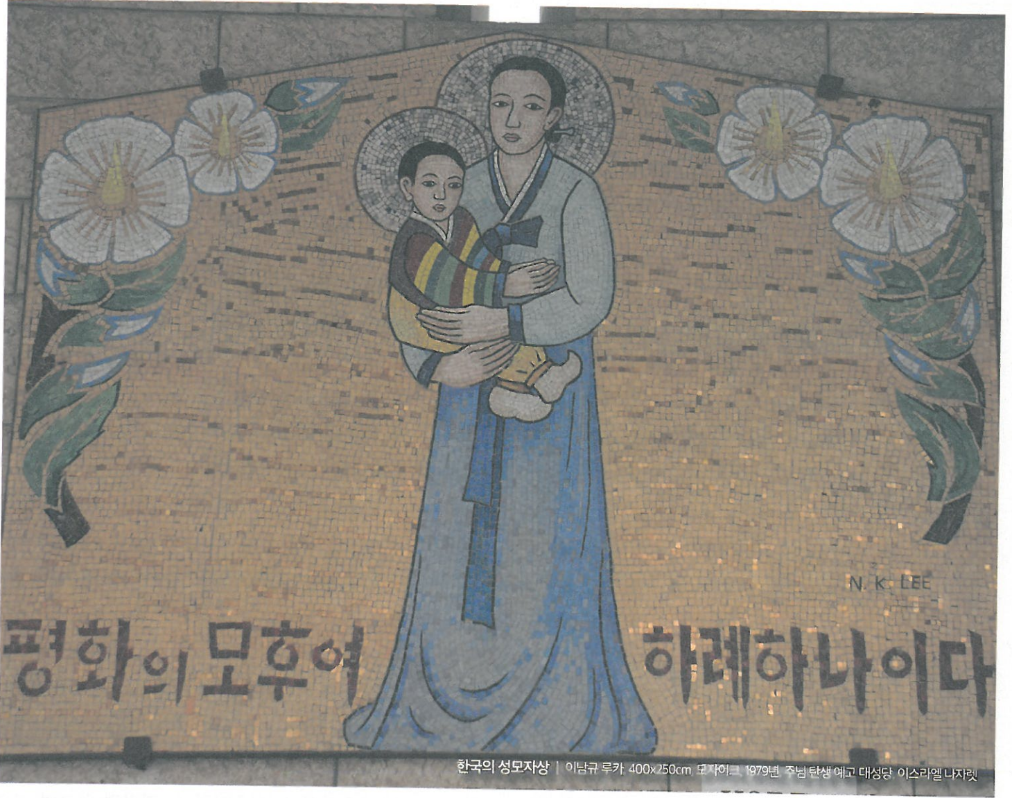
한국의 성모자상 | 이남규 루카 400x250cm 모자이크 1979년 주님 탄생 예고 대성당 이스리엘나지렛